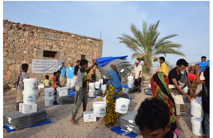
السكان المتضررين من إعصار ميكانو يستلمون المواد غير الغذائية المقدمة من المفوضية السامية للأمم المتحدة لشؤون اللاجئين في سقطرى.

وفرت هذه التوزيعات للعائلات المساعدة الضرورية لإنقاذ الأرواح من أجل التخفيف من معاناتهم وتمكينهم من الوصول إلى المواد غير الغذائية الأساسية. تم توزيع حزم المأوى الطارئ المحسن من قبل منظمة الهجرة لدولية على 500 عائلة متضررة من إعصار ميكانو في سقطرى، وساعد المجلس النرويجي للاجئين 230 أسرة نازحة ومجتمع مضيف في منطقة القبيطه (لحج). التوزيعات استهدفت العائلات النازحة حديثه النزوح والاكثر ضعفاً. قدمت المساعدات النقدية لإعانات الإيجار من قبل المفوضية من خلال منظمه أنترسوس إلى 143 عائلة نازحة و 4 عائلات مجتمع مضيف في مديريات دار سعد، والشيخ عثمان، والمنصورة، وكريتر، وخور مكسر، والتواهي، والمعلا والبريقه (عدن) أيضاً 105 من العائلات النازحة وعائلة واحدة من عائلات المجتمع المضيف في كل من مديريات تين، الحوطة، القبيطه، المقاطرة (لحج). بالإضافة إلى ذلك، ساعدت جمعية التكافل الإنساني حوالي 153 عائلة نازحة و 47 عائلة من المجتمع المضيف في مديريه عتق (شبو). قدمت المساعدات النقدية الأمل للأسر النازحة التي تواجه الطرد بعد أن تأخرت في الإيجار المتراكم. قدمت مؤسسة التواصل منحة إعادة التأهيل لـ 47 عائلة نازحة تضررت منازلها في مديريه المعلا و 9 عائلات في مديريه خور مكسر (عدن) كما ساعدت شبكة استجابة المساعدة الي 236 عائلة في مديريه تين (لحج). وقد أتاحت هذه المساعدة لهذه الأسر إعادة تأهيل أجزاء من منازلها وإعادة حياتهم الاعتيادية ببعض من الكرامة.